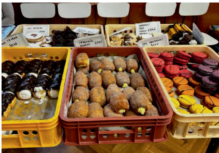
Velikonoční jarmark v Horním Studenci, str. 21