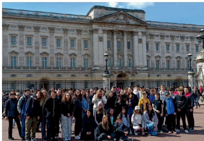
ZŠ Ždírec n. D. – Zájezd do Londýna