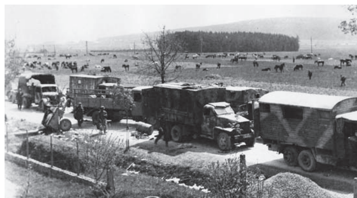
1945 – křižovatka na Pikulce

Po šesti letech utrpení se konečně blížil konec války. Od 6. května stále vidíme od Krucemburku ustupující armády vermachtu v plné zbroji. Rovněž byla ve Ždírci jeden den část armády Vlasova na koních, která rovněž ustupovala. V Kopanině se nacházeli rumunští vojáci, kteří čekali na konečný den války. Ten přišel podepsáním kapitulace Německa 8. 5. 1945. V továrnách se přestalo pracovat – byl konečně mír. Radost našich občanů byla velká. To jsme ještě nevěděli, co naši obec čeká příští den. Ustupující německá armáda zanechala dopoledne všechna auta a bojové prostředky na silnici, dnešní Žďárská ulice, a skryta v lesích ustupovala na západ. Bylo poledne 9. května 1945, středa. Ruská letadla