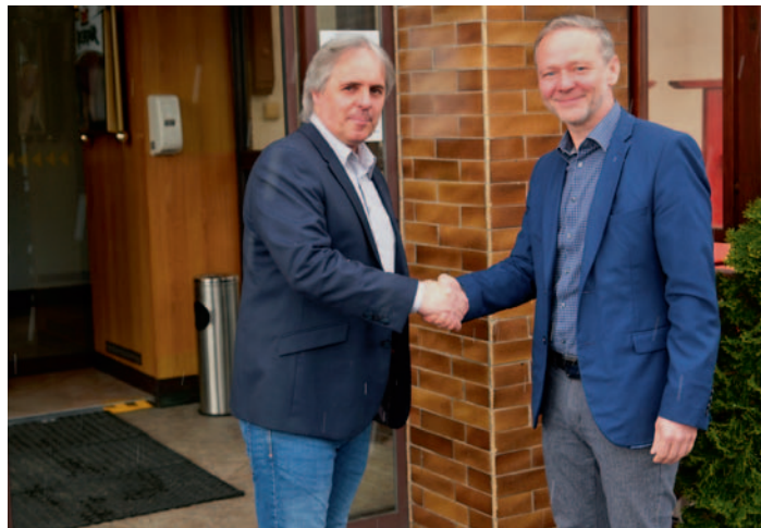
Rozloučení pana starosty s panem hejtmánem, str. 3