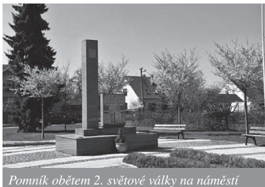
Pomník obětem 2. světové války na náměstí