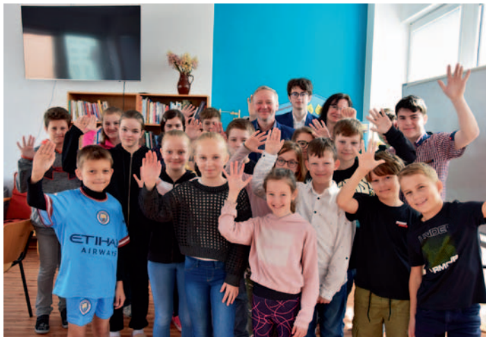
Hejtmán Kraje Vysočina v základní škole, str. 3