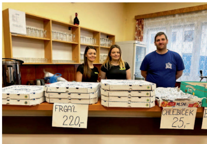
Velikonoční jarmark v Horním Studenci, str. 21