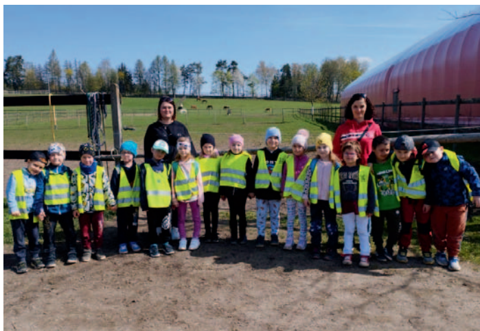
MŠ Ždírec n. D., návštěva Džekova ranče, třída Veverek