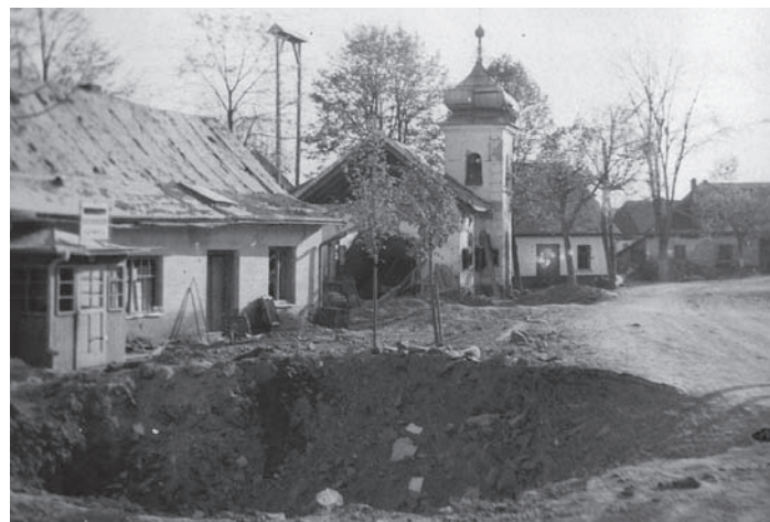
1945 – kráter u zvoničky