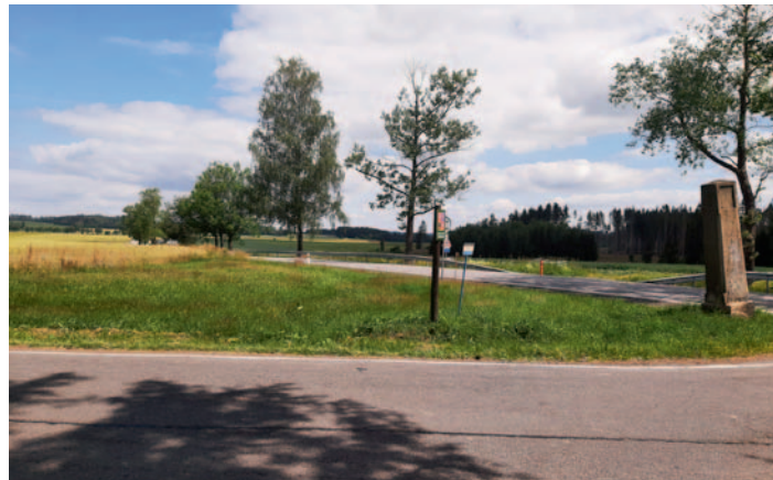
U hřbitova bude začínat cyklostezka na Údavy

Stezka je navržena jako bezbariérová a použité povrchy neznesou pohyb osob se sníženou schopností orientace. Finanční rozpočet na výstavbu cyklostezky je 35 mil. Kč s DPH.