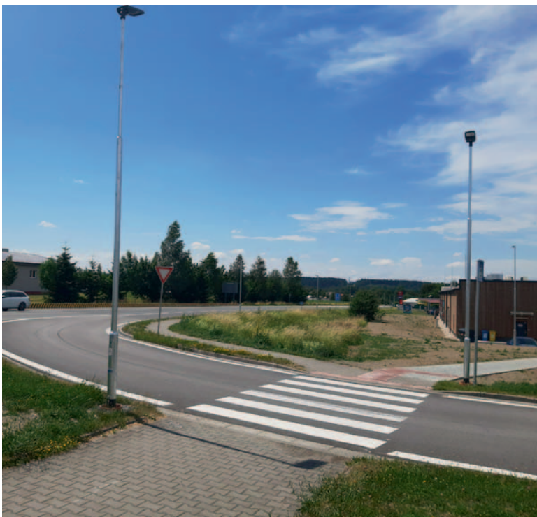
Nové veřejné osvětlení na kruhovém objezdu

Jedná se o nové osvětlení chodníku a přechodu pro chodce mezi Ždírcem nad Doubravou (kruhovým objezdem) a Novým Ranskem. Celkem je osazeno 22 stožárů veřejného osvětlení. U přechodu pro chodce jsou instalovány 2 ks osvětlovacích stožárů výšky 6 m a podél chodníku je instalováno 20 ks osvětlovacích stožárů výšky 5 m. Na všechny stožáry jsou namontovány LED svítidla. Výstavbu veřejného osvětlení provádí firma Elter, s.r.o., Hlinsko v Č. Cena za dílo je 1,438 mil. Kč.