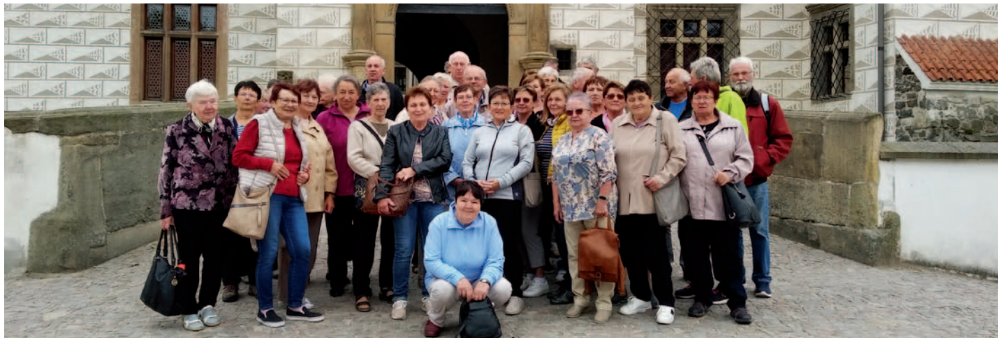
Klub seniorů, str. 2