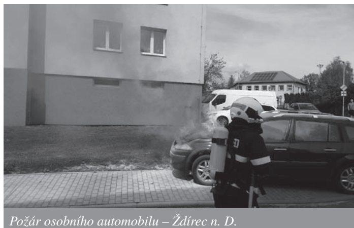
Požár osobního automobilu – Ždírec n. D.