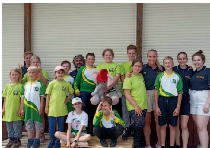
Mladší a straší MH po soutěži ve Žďírce n. D., str. 18