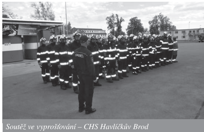
Soutěž ve vyprošťování – CHS Havlíčkův Brod