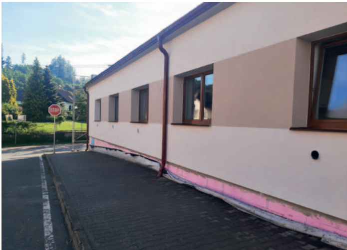
Zateplení je prováděno i na restauraci a bytu KD v H. Studenci

půdy, výměny nevyhovujících oken a dveří a zateplení střechy nad sociálním zařízením restaurace. Smlouva o dílo na tuto energetickou optimalizaci objektu KD v Horním Studenci je sepsána s firmou Stavitelství Adamec s.r.o. z Havlíčkova Brodu. Vysoutěžená cena za dílo je 4,92 mil. Kč. Město na tento projekt získalo dotaci ze Státního fondu životního prostředí ČR v rámci Národního plánu obnovy ve výši 1,88 mil. Kč.