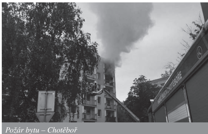
Požár bytu – Chotěboř