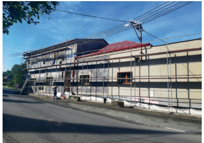
Zateplení budovy Kulturního domu v Horním Studenci