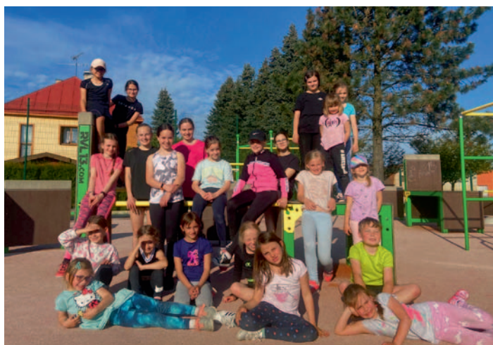
ASPV – Cvičební rok zakončen, str. 2