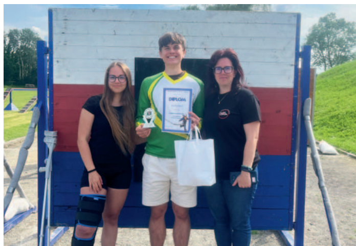
Okresní kolo dorostu v Havlíčkově Brodě – 1. místo