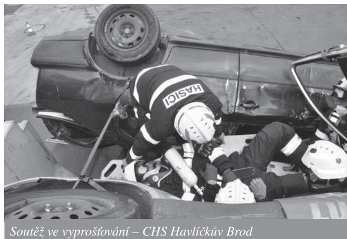
Soutěž ve vyprošťování – CHS Havlíčkův Brod