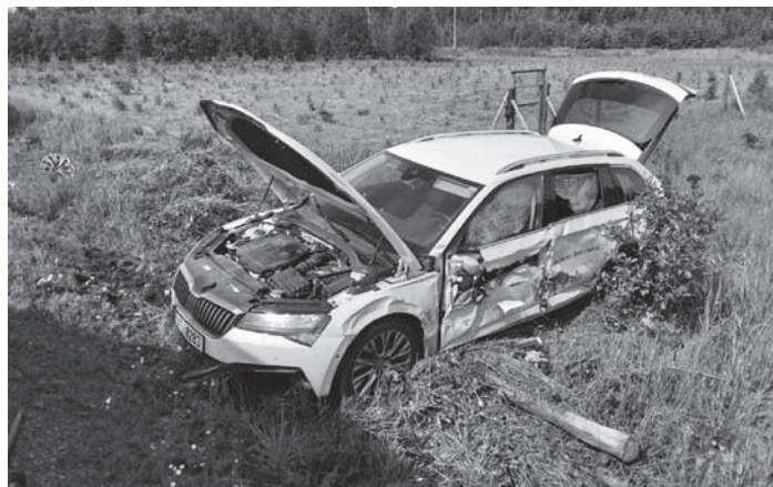
Dopravní nehoda u obce Dlouhý