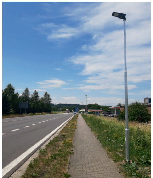
Nové veřejné osvětlení směr Nové Ransko