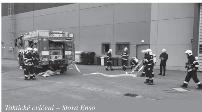
Taktické cvičení – Stora Enso