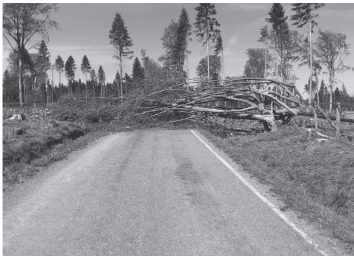
Strom na komunikaci – Slavíkov

16. 5. 2024 v 17.14: Ohlášena dopravní nehoda dvou osobních automobilů bez zranění s únikem provozních kapalin, na silnici I/37 před obcí Karlov. Zajištění místa nehody, provedení protipožárních opatření. Zасыпání úniku provozních kapalin sorbentem a úklid komunikace. Spolupráce s CHS (Centrální Hasičská Stanice) Žďár n. S. a PČR.