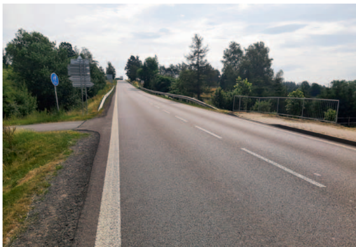
V těchto místech bude nový přechod na cyklostezku

V současné době je vypsána veřejná soutěž na zhotovitele tohoto projektu.