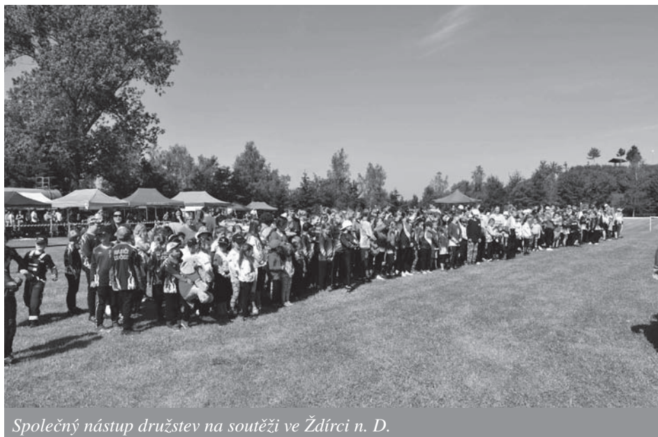
Společný nástup družstev na soutěži ve Ždírci n. D.