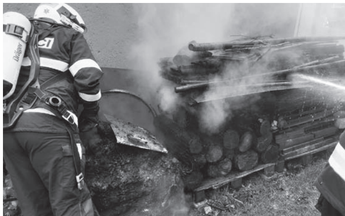
Požár dřeva – Krucemburk