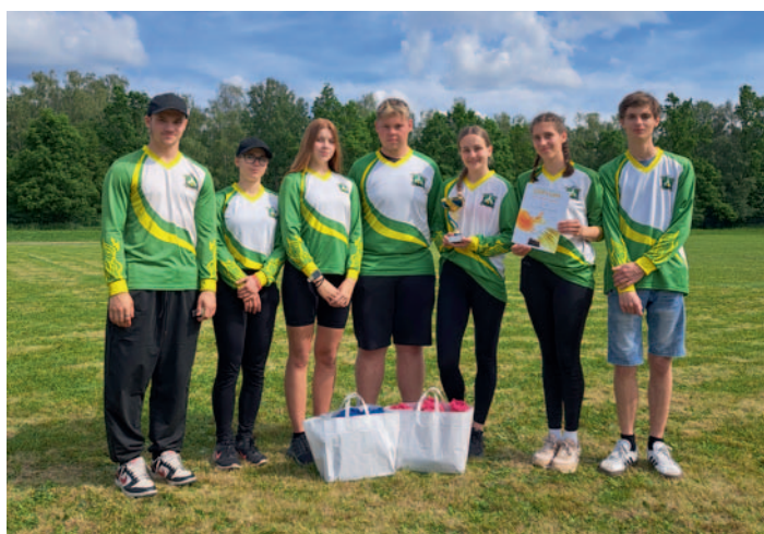
Dorostenci na okresním kole v Havl. Brodě, str. 18