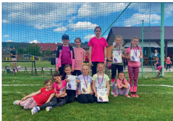
ASPV – Medvědí stezka Maleč, str. 2