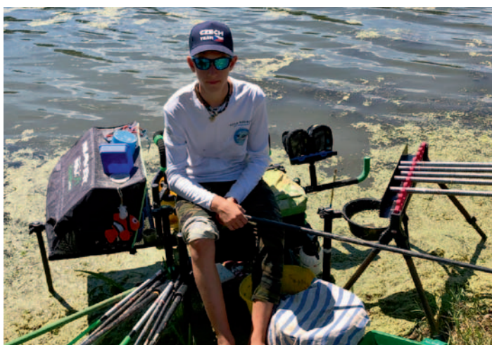
Mladý rybář, str. 24