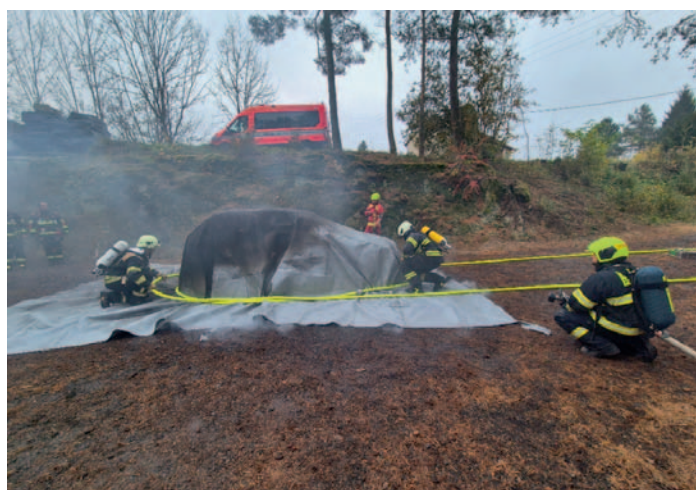
Činnost JPO II elektromobilita, str. 20