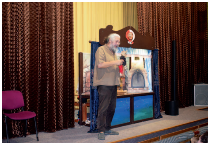
O perníkové chaloupce, str. 2