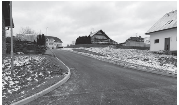
Místní komunikace v ulici V Údolí po stavebních úpravách