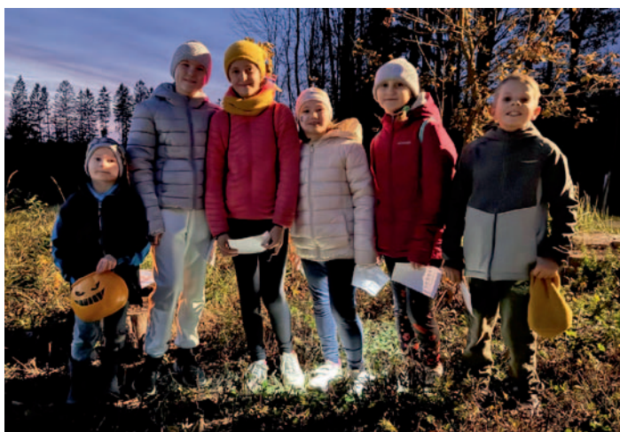
SDH Horní Studenec, str. 21