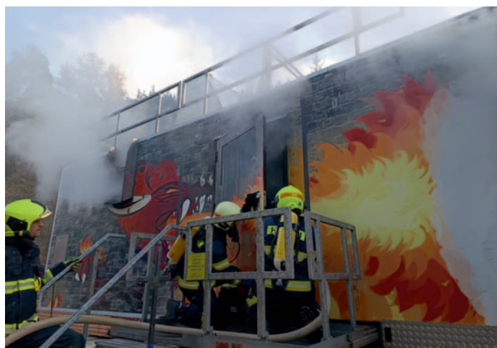
Činnost JPO II Fire Dragon 9000, str. 20