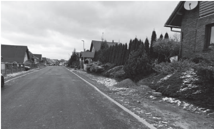
Místní komunikace v ulici V Údolí po stavebních úpravách