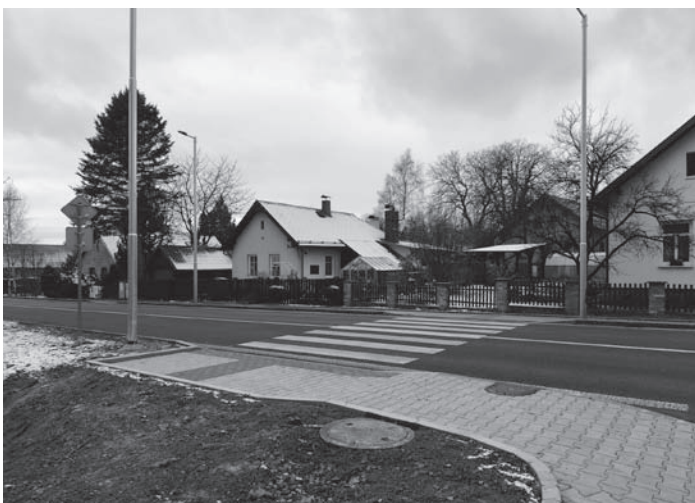
Nový přechod pro chodce v Benátkách