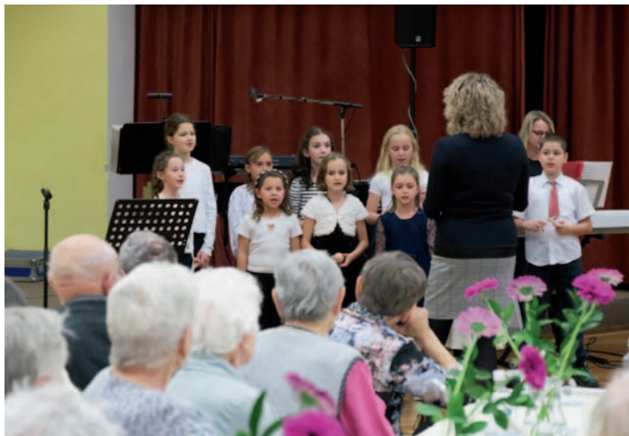
Setkání seniorů dříve narozených v Horním Studenci, str. 1