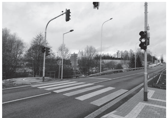
Nový přechod pro chodce na cyklostezku do Kohoutova